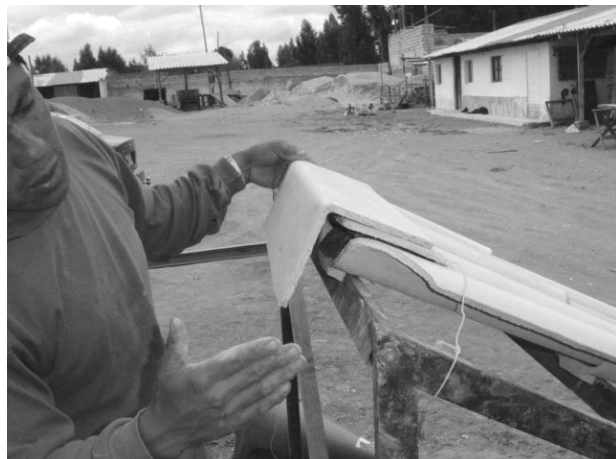
Si el techo es a una sola agua, se colocan botaguas a 90 grados en lugar de cumbreras