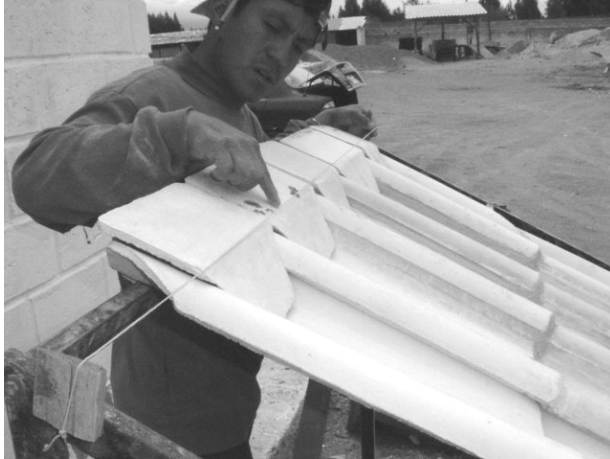
Alinear con un hilo y nivel los accesorios tapaonda