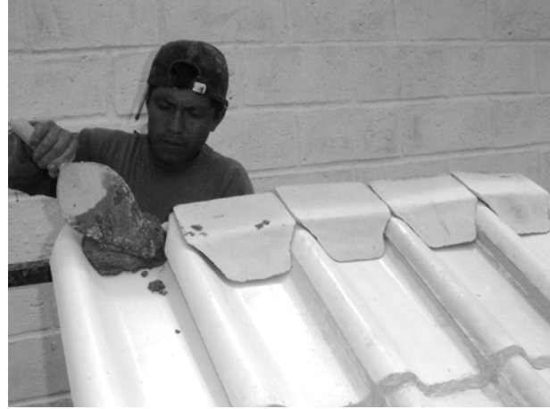
Colocar mezcla suficiente para un agarre perfecto entre el accesorio y la teja